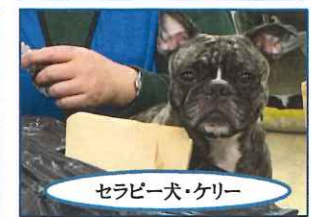
セラピー犬・ケリー